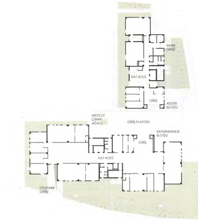
GİRİŞ KAT PLANI