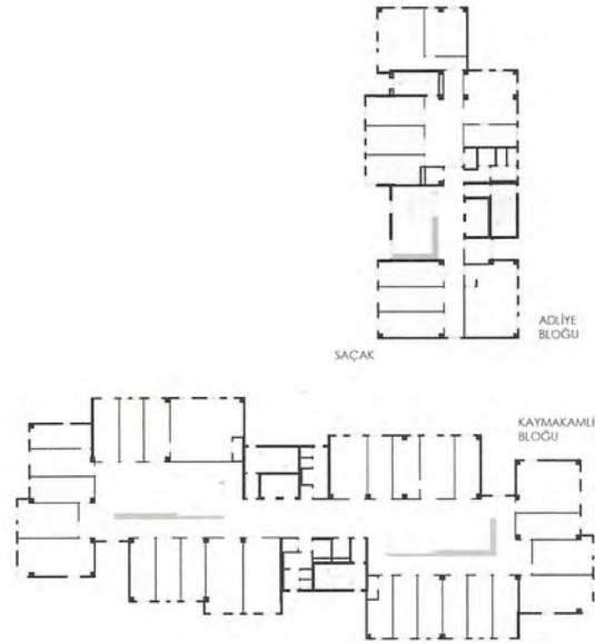
1. KAT PLANI